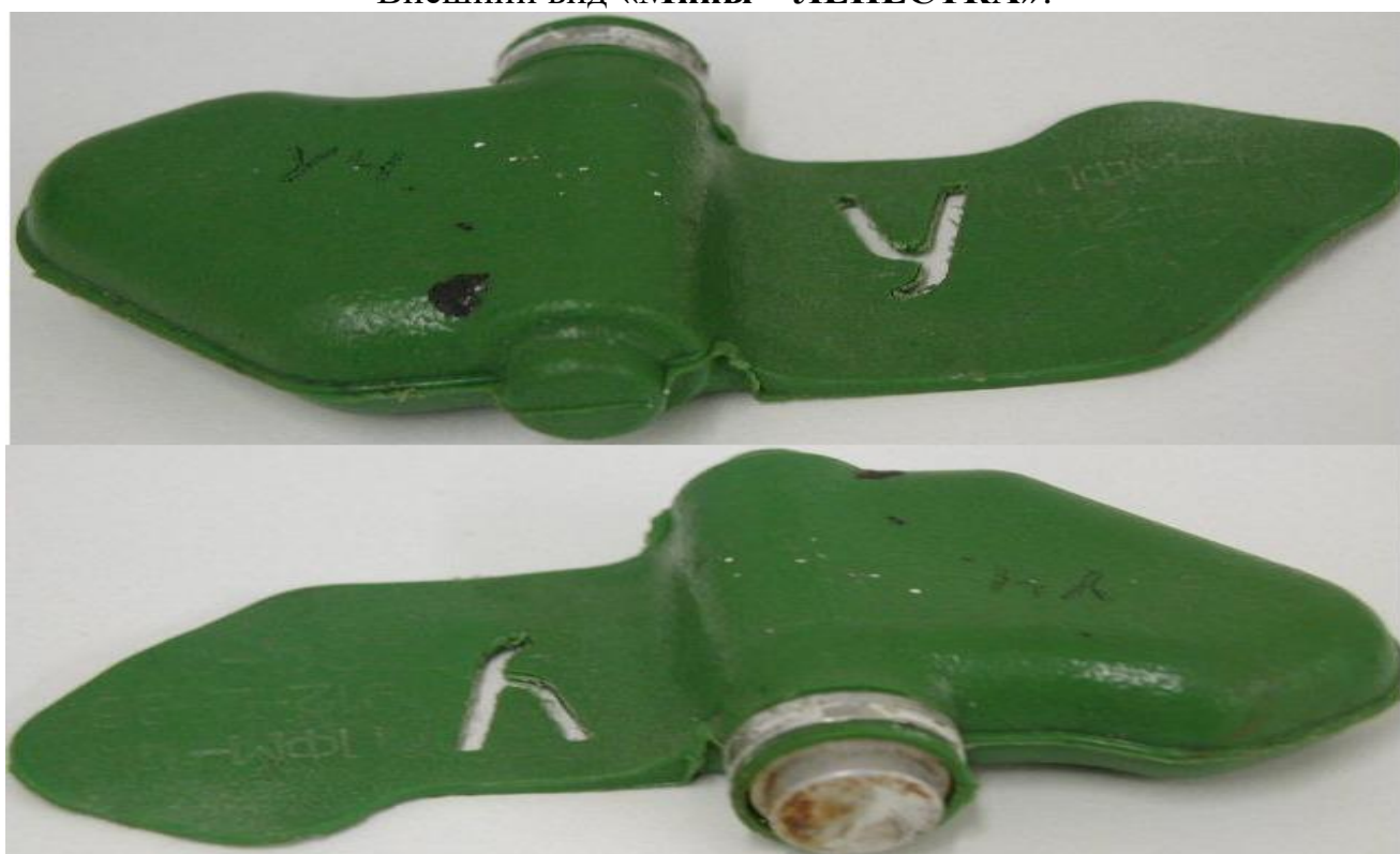
Внешний вид « Мины – ЛЕПЕСТКА »:

Масса мины 80 грамм, размеры – 12 x 6 сантиметров, чувствительность мины лежит в пределах 5-25 кг, что вполне достаточно для срабатывания от веса маленького ребенка.